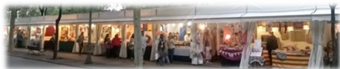
Panoràmica de la mostra organitzada a la Fira Modernista durant la Festa Major de la Dreta de l'Eixample al 2015

L' Associació Sabors Catalans va ser escollida per l' Ajuntament de Tarragona per realitzar a la Rambla Nova les seves activitats. A més, recentment, hem guanyat el concurs del Port Vell de Barcelona , per instal·lar una fira gastronòmica de gran qualitat tots els diumenges i festius, durant els propers tres anys, contra les empreses més importants del sector, amb un 60% de puntuació superior a tots ells, per la qualitat, preu de licitació, muntatge, coordinació i responsabilitat amb l'entorn.