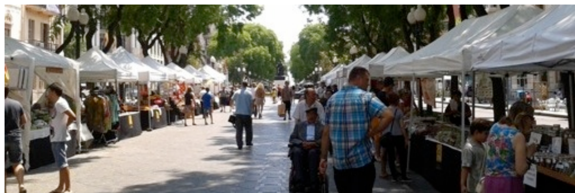
Imatge de la mostra de "Sabors Artesans" a la Rambla Nova de Tarragona