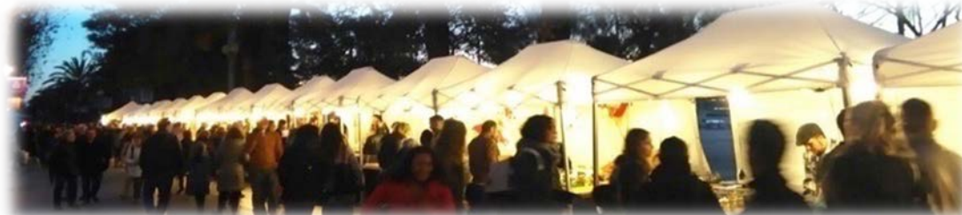
Panoràmica de la Fira de Gastronomia Artesana al Passeig de Joan de Borbó (tots els festius)