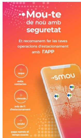
Imatge de la campanya de l'app smou

Una bona alternativa als parquímetres és l'app smou, que incorpora diversos serveis i entre els quals es troba l'apparkB, que permet pagar l'estacionament a l'AREA Verda i Blava. En aquest sentit, l'smou permet gestionar l'estacionament de manera ràpida, senzilla i còmode, directament des del telèfon mòbil, i tenint en compte la situació sanitària actual suposa una mesura de protecció més per evitar tocar la pantalla tàctil del propi parquímetre. L'smou està disponible per a la seva descàrrega gratuïta a dispositiu iOS i Android.